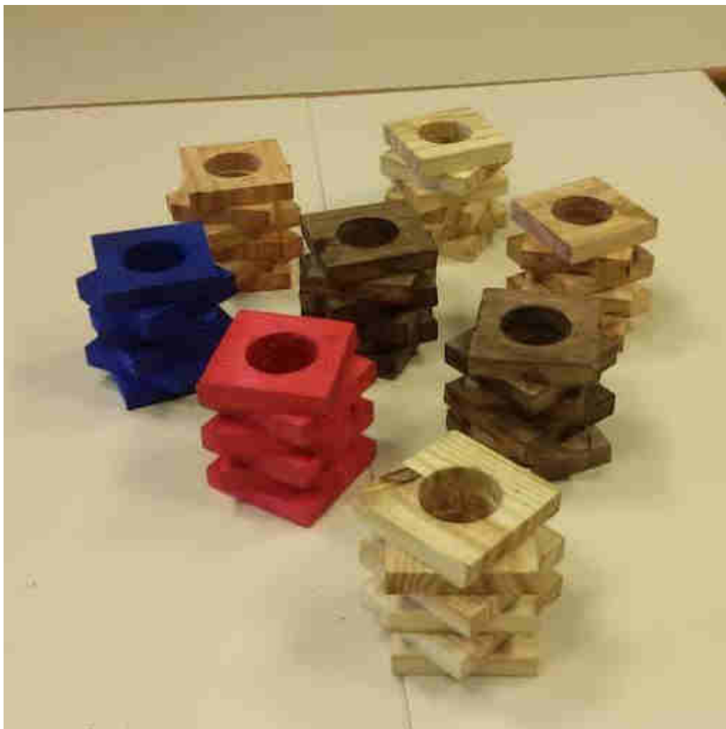
Les pots à crayons en cours de décoration