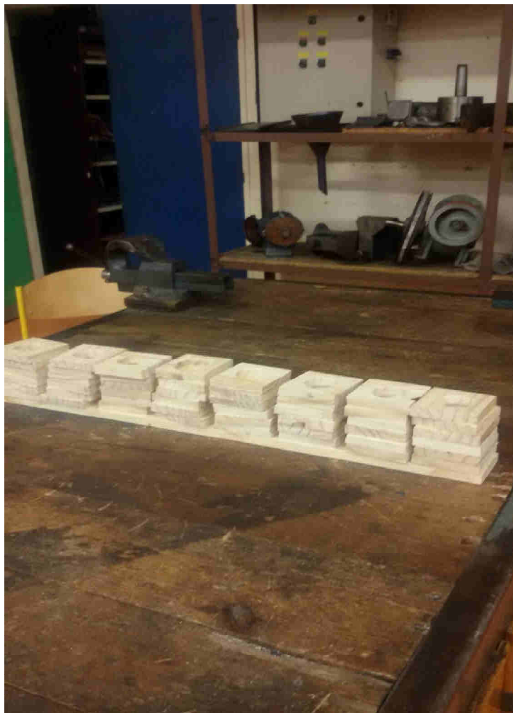
Les pots à crayons prêts à être décorés